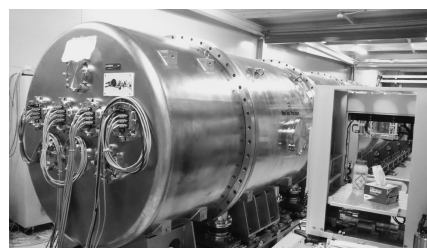
図2 SAXS の検出器