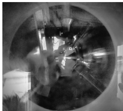
図1 紫外線ランプ照射中の APXPS チャンバー内の様子

私がこの school に参加した一番の目的である「希望のビームラインを利用した実習・発表」は5日目に設けられた。私が希望したのはビームライン TLS 24A での大気圧下光電子分光（APXPS）を用いた触媒反応の観測である。私はこれまで高い真空度を必要とする光電子分光実験や X 線吸収分光実験などの経験しかなく、大気圧下での光電子分光実験に関して興味があったため、この実習課題を希望した。実験は、TiO 2 に関して表面処理（スパッタリング）の有無や雰囲気ガスの種類や触媒反応を促進させ