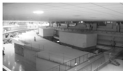
図1 TPS 内部の写真

ビームライン実習は、7つのグループに分かれ、一日目にデータ収集と解析、次の日に15分程度のプレゼンテーションをするというスケジュールのもと行われた。筆者は SAXS のグループで実習を行った (測定は図2に示す TPS ビームラインではなく TLS ビームラインにて行われ