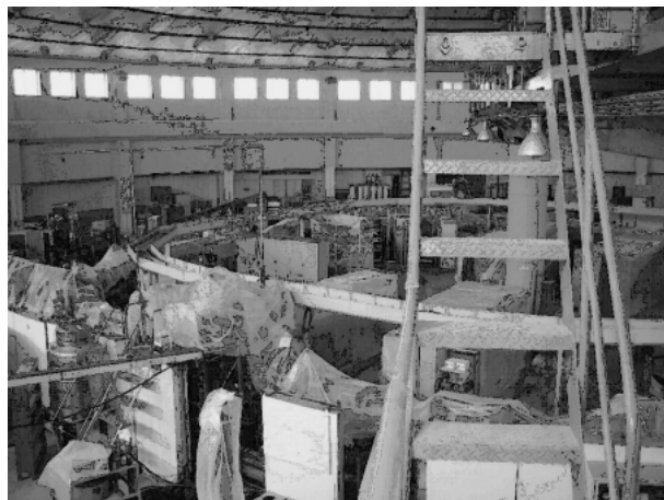
写真2 NSRLの実験ホール内の様子。リング全体の改修工事が行われており、リング、ビームラインにはビニールカバーがかぶせられている。