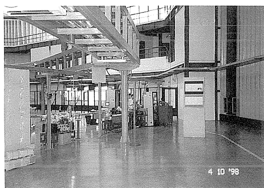
写真2 まだビームラインがおいてないので、テニスの壁うちができそうなガラとした施設内部。遠くに見えるのが、筆者が実験したSGMビームライン。

て間もないためスペースがかなりあり、ゆったりして実験がしやすかったです。特に私はUVSORのつめこまれたところでいつも実験しているので余計にそう感じました。