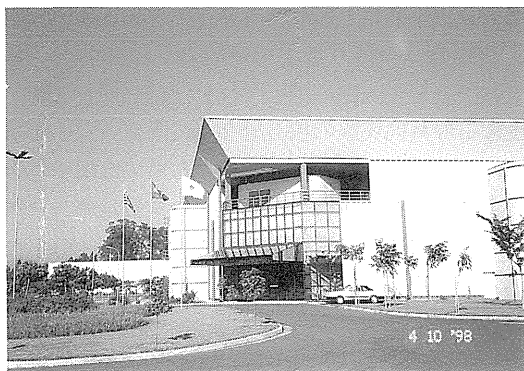
写真1 正面から見たLNLS。